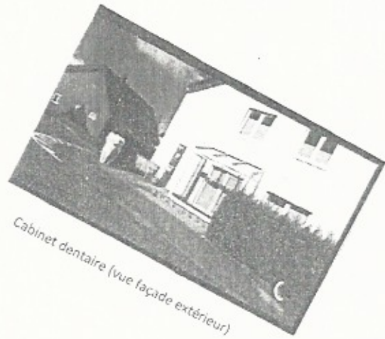
Cabinet dentaire (vue façade extérieur)