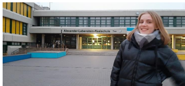
2 Entrée du collège

Collège Alexander-Liebenstein d'HALTERN AM SEE