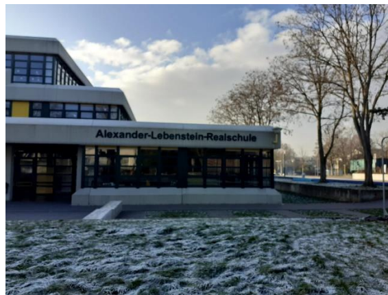
1 Alexander-Liebenstein-Realschule d'HALTERN AM SEE