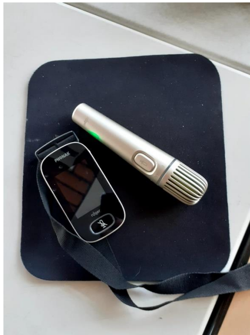
5 Microphones pour professeur et élèves

J'ai été surprise par les objets multimédias et technologiques grandement présents dans le collège. Chaque professeur et de nombreux élèves ont un I-PAD qu'ils utilisent quotidiennement. Certaines classes ont des élèves qui relèvent du champ du handicap, dans l'une de mes classes, trois élèves souffraient de troubles auditifs. Pour compenser cela, lors de prise de parole les élèves devaient parler dans un micro et le professeur en possédait également un autour du cou. Les micros étaient reliés à l'appareil auditif des élèves ce qui les permettaient de bien entendre le cours.